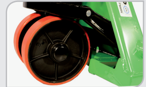
Fácil rodadura Diámetro de ruedas extragrande.