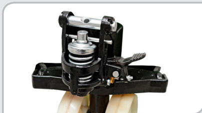
Grupo hidráulico sobredimensionado 2.500 kg. Protección del muelle. Pedal auxiliar de bajada.