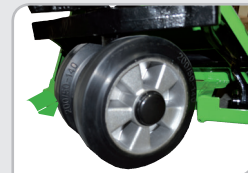
Nuevas ruedas Caucho macizo y llanta metálica