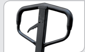
Empuñadura de caucho Mayor confort.