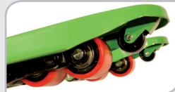
Doble tandem + rueda de ataque.